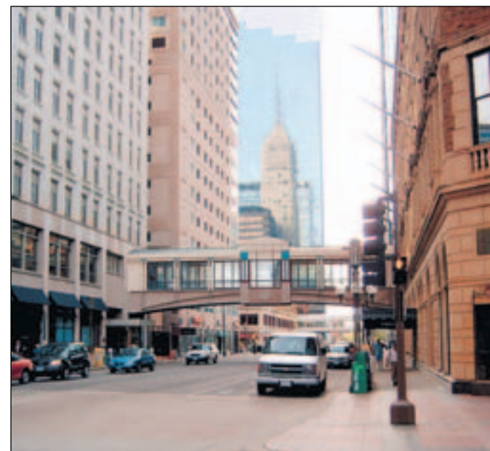
Minneapolis a trouvé la parade aux hivers rigoureux : les Skyways, vaste réseau de passerelles qui relient entre eux les différents buildings. De quoi profiter au chaud des nombreuses animations proposées pendant la période froide.