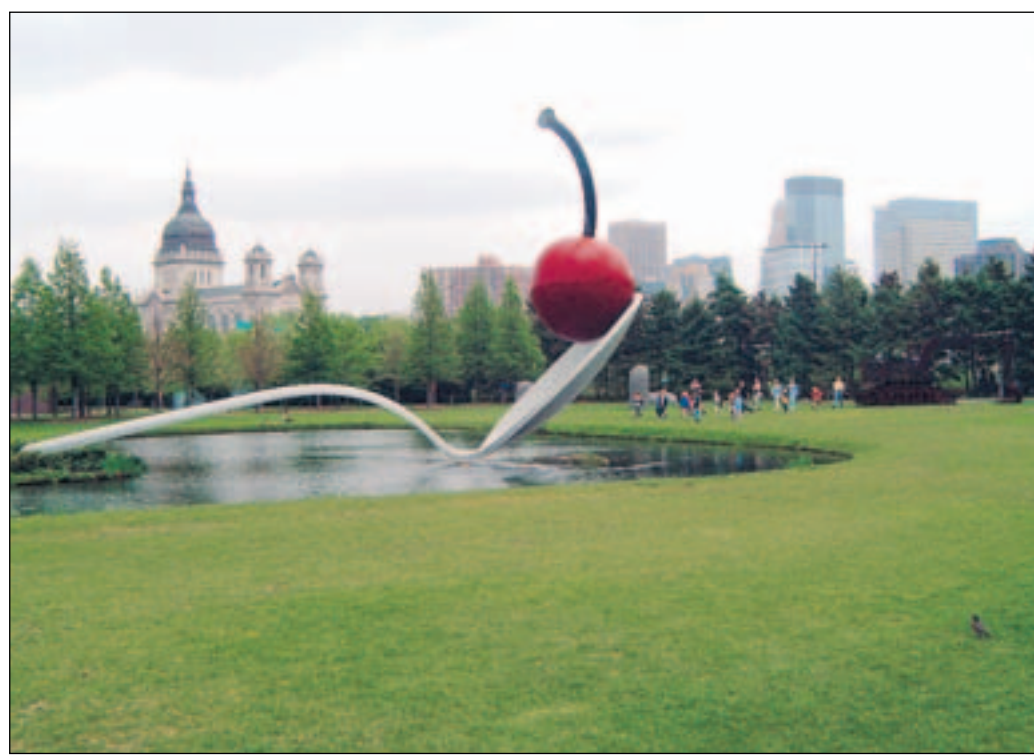
Le Sculpture Garden, jardin où foisonnent les œuvres d'art, est devenu un des symboles de Minneapolis.

Tout comme sa voisine Saint-Paul, avec laquelle elle forme la mégapole des Twin Cities, Minneapolis a assis sa puissance sur l'exploitation de cette nature généreuse, grâce au commerce du blé et à la meunerie. Un musée est du reste dédié à ces activités, sur les bords du Mississippi. Et la dimension végétale reste prégnante dans