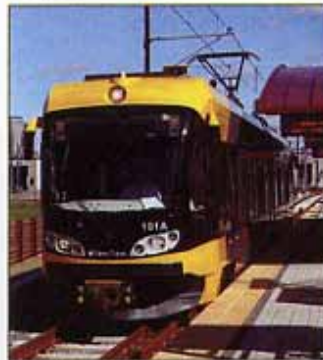
Train léger sur rail Hiawatha Line

Nationalement acclamée pour sa qualité de vie élevée, la zone urbaine Minneapolis-Saint Paul offre à la fois l'hospitalité d'une petite ville et le divertissement d'une grande ville. Des Villes Véritables. L'Amérique Véritable.